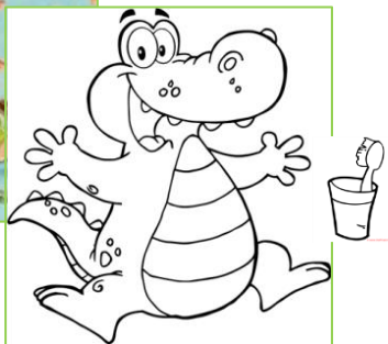
Zahngesundheit - Untersuchung